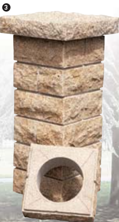
2 3 Mod. POLO 33 Dimensioni elemento Dimensions de l'élément cm 33 x 33 x 14 h Foro interno / Orifice intérieur Ø cm 23 Copripilastrò / Couvre-pilier cm 43 x 43 x 8 h Materiale / Matériau: Granito grigio o giallo Granit gris ou jaune

Qualsiasi altra misura o finizione a richiesta. Toutes les autres dimensions ou finitions sur demande.